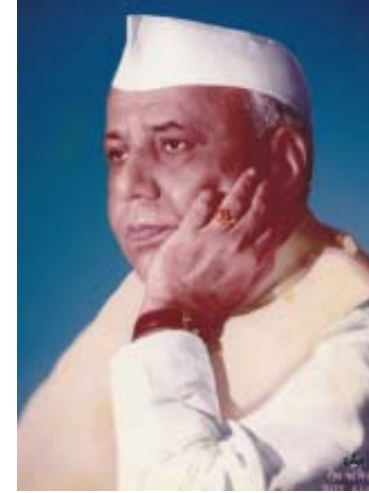
स्व. यशवंतरावजी चव्हाण को सादर समर्पित